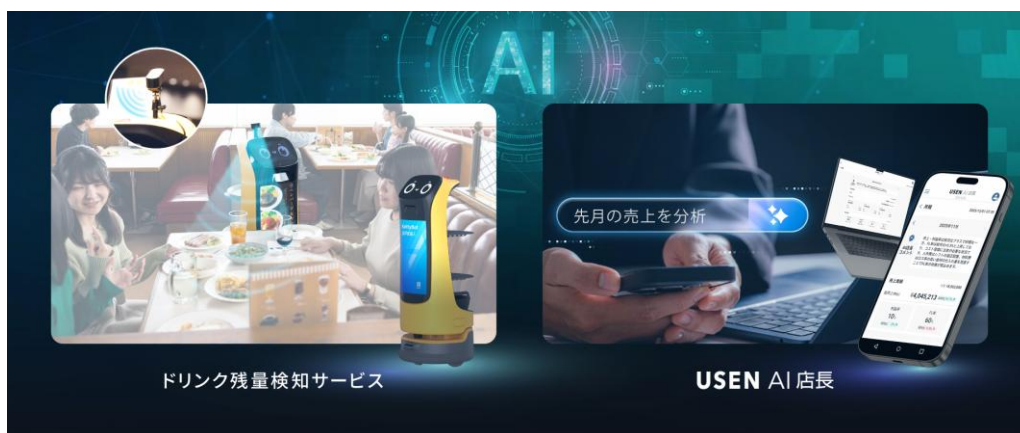
ドリンク残量検知サービス / USEN AI 店長

『ドリンク残量検知サービス』は、AIセンサーカメラが客席のドリンク残量をリアルタイムで検知・判別し、最適な「おかわりタイミング」を通知。卓上・壁面への固定設置のほか、配膳ロボット『KettyBot Pro』への搭載にも対応します。また、『USEN AI 店長』は蓄積された店舗データをもとに、飲食店経営に特化したAIが分析・アドバイスします。