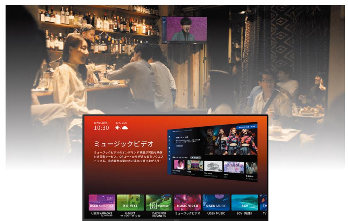
『USEN MUSIC Entertainment』サービスサイト