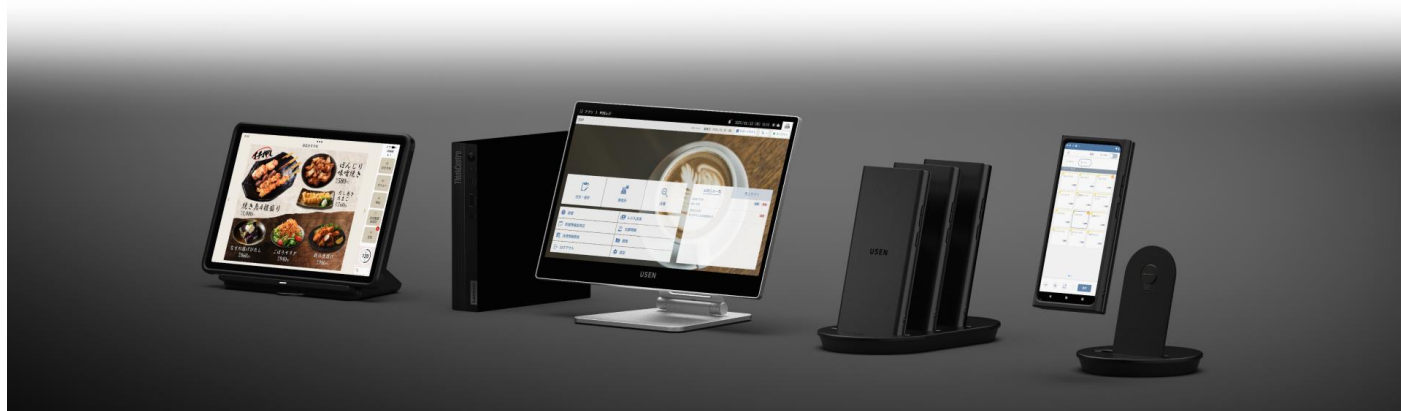
『USEN レジ』 サービスサイト