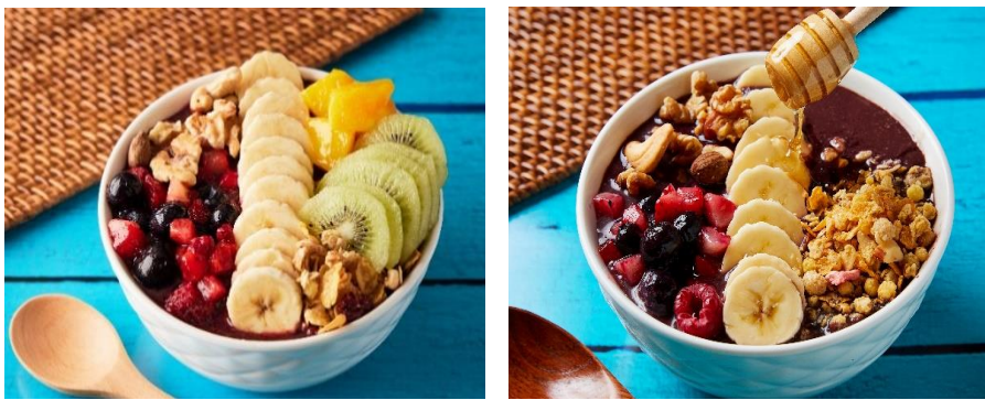
写真左から：超豪華！！フルーツ全種盛りの贅沢アサイーボウル、王道人気！ハニーアサイーボウル