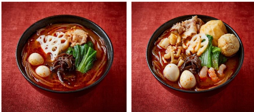
写真左から：人気トッピング麻辣湯、スペシャル麻辣湯