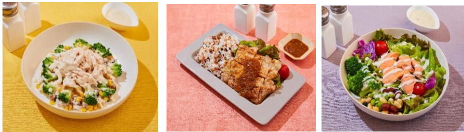
写真左から：スチームチキンボウル、 Grillチキンボックス、 Grillサーモンサラダ

*本リリースに記載している種類・価格は、2025年2月時点のデリバリープラットフォーム上での販売情報となります。加盟店が店舗メニューとしてイートインやテイクアウトで販売している場合、店舗ごとに種類・価格は異なります。