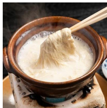
【京ゆば処 静家 二条城店】