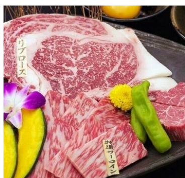
【松阪牛 WHAT'S 京都室町店】