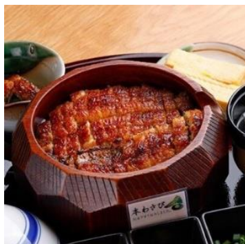
【鰻 炭焼 ひつまぶし 美濃金 神田本店】