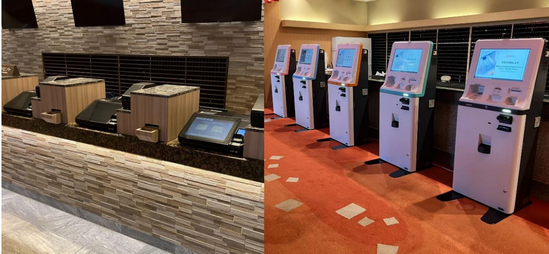
サービスサイト： 『KIOSK』 、 『FIT-A』