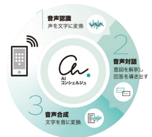
『AI コンシェルジュ®』サービスイメージ

『AI コンシェルジュ®』詳細はこちら： https://www.tactinc.jp/ai