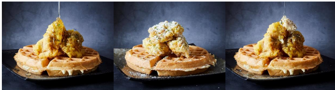
(写真左から：ハニー、ハニーバター、クリチペッパーハニー)

ふわふわのワッフル生地には、ほんのり甘いサクサクの衣が特長のフライドチキンをのせました。甘じょっぱい風味のハニーワッフルチキンや韓国チキン風のヤンニョムチキンなど好みの味を選択いただけます。