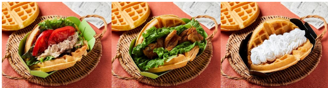
(写真左から：ツナトマト、照り焼きチキン、ホイップ)

朝食、ランチ、ディナー、どのシーンでもお召し上がりいただけるワンハンドフードが登場！照り焼きチキンやBLTのおかず系ワッフル、ホイップクリームのデザートワッフルなど気分によって楽しめます。