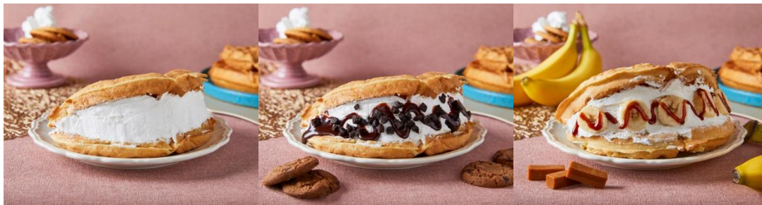
（写真左から：ホイップ、ココアクッキーチョコ、キャラメルバナナ）

「トウン」は韓国語で「太っちょ」を意味するように、たっぷりのクリームを挟んだデザートワッフルです。ワッフル生地は各店舗で手作りし、専用のマシーンで焼いているため、やわらかでもっちりとした食感が特長です。