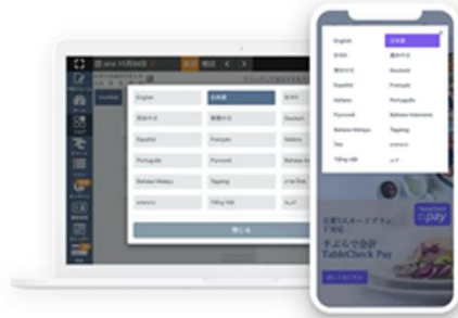
(テーブルチェック予約画面)

『SAVOR JAPAN』は今後も各種台帳やアライアンスパートナーとの連携を強化し、より利便性の高いサービスの実現と、日本の「食」を楽しみに訪れる外国人観光客にスムーズなレストラン予約を提供し、日本の観光と飲食ビジネスに貢献することを目指します。