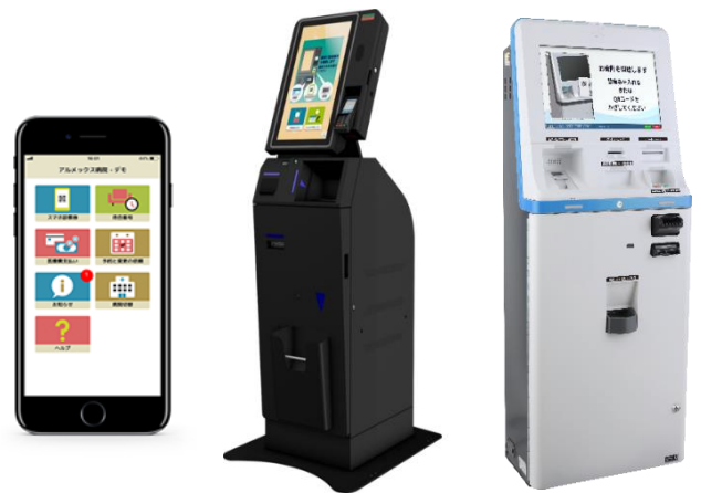
写真左から：『Sma-Pa アプリ』『Sma-pa TERMINAL』『FIT-A』

両社は病院・クリニックの業務を効率化し、病院スタッフ様がよりお客様の対応に注力いただけるよう、今後も病院・クリニックの DX 化を推進してまいります。