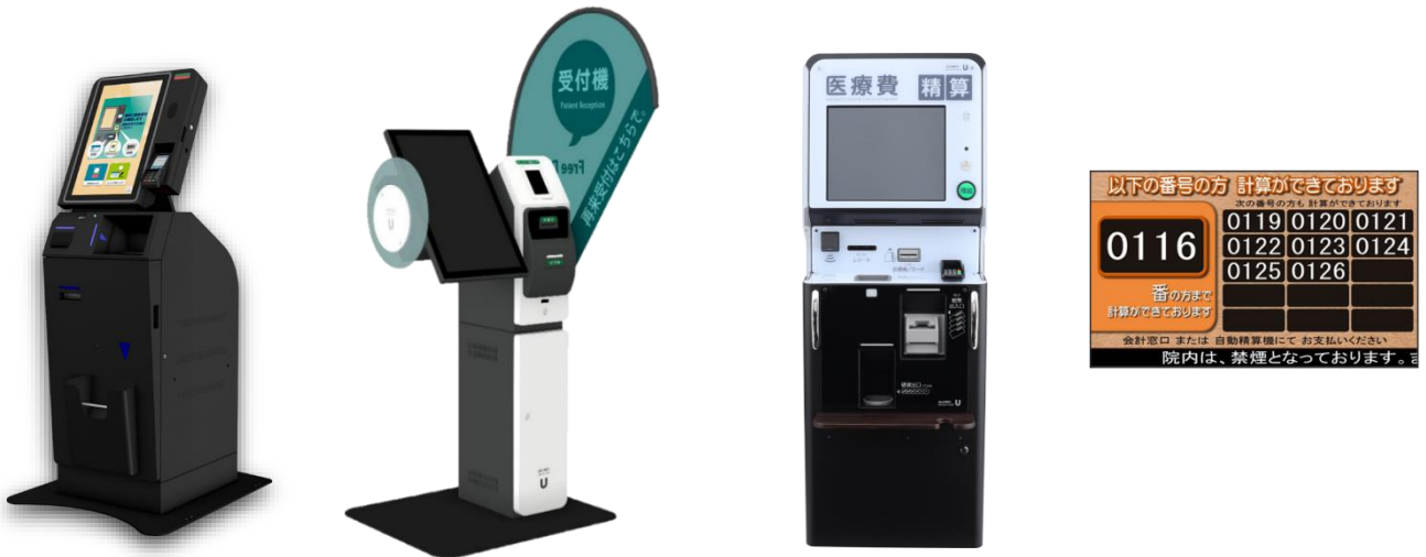
写真左から『Sma-pa TERMINAL』、『APS-NEXT』、『TH-X』、『会計待ち番号表示システム』

アルメックス医療機関向け製品・システム： https://www.almex.jp/products/industry/medical/