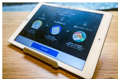
スマチエ(オプション)