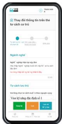
【外国人専用入力フォーム】

特定技能に特化した『とくマネ』は、登録支援機関、外国人、受入機関、各々にアカウントを発行し、それぞれの情報を一元化。登録支援機関、外国人、受入機関、それぞれが質問に答えていくだけで申請書類へ自動入力されます。一括修正機能や複製機能などの補助機能も充実しているため、円滑かつ迅速な書類作成業務を可能にするだけでなく、書類作成漏れや記載ミスも防ぐことができます。10カ国語の翻訳機能が搭載されているので、外国人は母国語で迷わず入力でき、各種申請帳票の出力も容易になります。