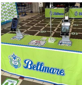
各ゲートに機器を設置