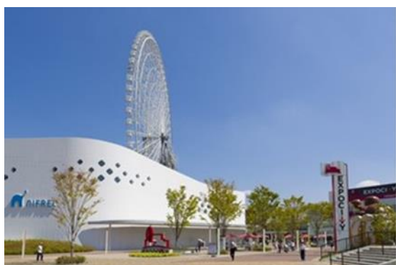
【三井ショッピングパーク ららぽーとEXPOCITY】