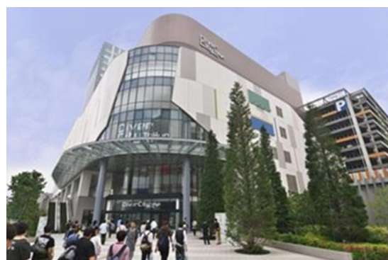
【ダイバーシティ東京 プラザ】